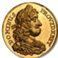
Norway. 2 Ducats, ND. Frederik III. Fr-5b. Bruun-6738. NGC MS-66★.