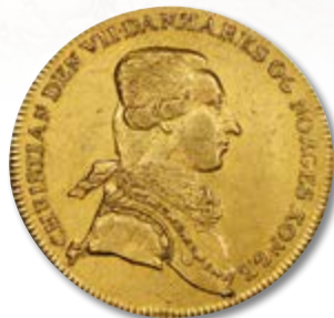
Denmark/Norway. 20 Ducats, 1788-MF. Christian VII. Fr-unlisted. Bruun-7894. NGC AU Details.