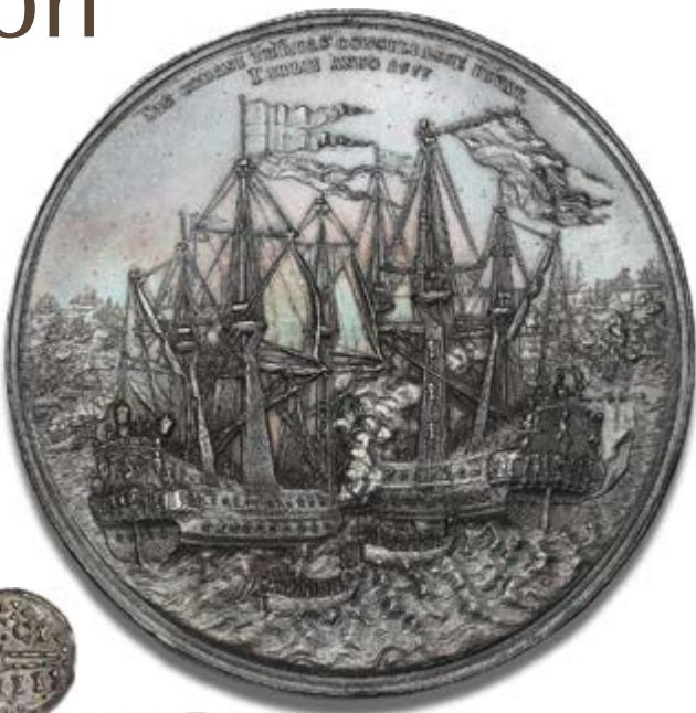
Christian V, 1670-1699 Søslaget i Køge Bugt, sølvmedalje 1677 Hammerslag: 440.000 kr.