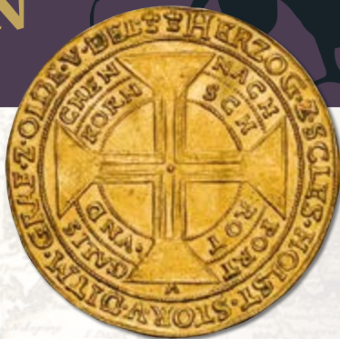
Schleswig-Holstein-Gottorp. 10 Ducats (Portugaloser), ND. Johann Adolf. Fr-1502 var, Bruun-14145. NGC Unc Details—Cleaned.

Auction lots will be available for viewing in the U.S. and in Europe in advance of the auction.