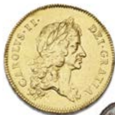
Charles II, 1660-1685 5 Guineas 1672, London Hammerslag: 70.000 kr.