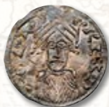
Denmark. Penning, ND (1086-1095). Oluf Hunger. Bruun-2047. NGC Unc Details.