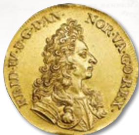
Denmark. 10 Ducats, 1699. Frederik IV. Fr-213. Bruun-7296. NGC MS-60.