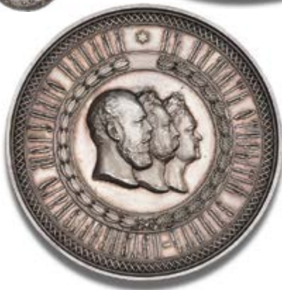
Rusland Alexander III "Memory of the Opening of St. Peterburg Maritime Canal" sølvmedalje 1885 Hammerslag: 60.000 kr.