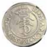
Fr III, 2 Mark 1660 vurdering eur 100 - 150

der sælges på online auktion 19. - 21. februar 2025