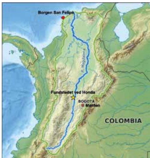
Floden Magdalena løber fra Andesbjergene i det sydvestlige Colombia og udmunder i det Caribiske Hav, den er 1.540 km lang.

Deres smarteste "investering" var nok at bruge deres sidste skejser på en ny bil, men den skulle så alligevel