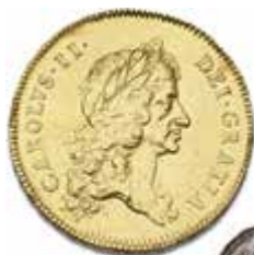
Charles II, 1660-1685 5 Guineas 1672, London Hammerslag: 70.000 kr.