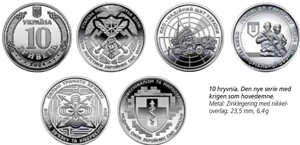
10 hryvnia. Den nye serie med krigen som hovedemne. Metal: Zinklegering med nikkel- overlag. 23,5 mm, 6,4g

Vi hører meget om krigen i Ukraine og om hvordan det påvirker livet for almindelige ukrainere og vitale samfundsinstitutioner – det har sine dybe konsekvenser at gå fra almindelig international handelsøkonomi og til at indstille et så stort land på krigsøkonomi.