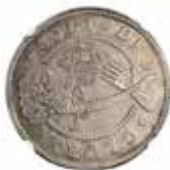
Fr III, Eben Ezer Krone 1659 vurdering eur 1000 - 1500