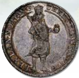
Denmark. Speciedaler, 1682. Gluckstadt Mint. Christian V. Dav-3676, Bruun-7274. NGC MS-63.