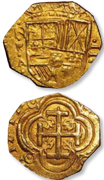
Cobs-mønter ser altid lidt ufærdige ud, men de er deres vægt værd i guld og sølv.

Mønterne de var lastet med, var de såkaldte 'cobs', hurtigtproducerede mønter der bar præg af irregulære blanketter og svagpræg, som for spanierne var fuldstændigt ligegyldigt – bare de vejede det de skulle og var af den korrekte lødighed! Især guldmønterne fascinerede mig, men efter et hurtigt kig på Ebay realiserede jeg, at dette nok aldrig blev en realitet. Indtil at jeg en skønne dag så