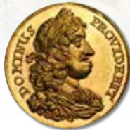
Norway. 2 Ducats, ND. Frederik III. Fr-5b. Bruun-6738. NGC MS-66★.