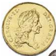
Charles II, 1660-1685 5 Guineas 1672, London Hammerslag: 70.000 kr.