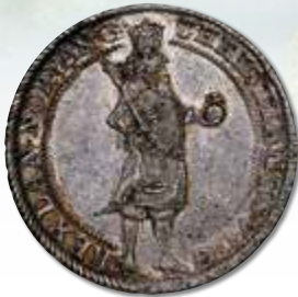
Denmark. Speciedaler, 1682. Gluckstadt Mint. Christian V. Dav-3676, Bruun-7274. NGC MS-63.