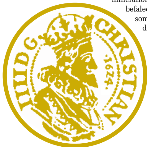
Figur 1. BørsMønten med udgangspunktet – Halvkronen 1624 (Hede 128, AH 23.13.3. Det bemærkes, at det er varianten uden 'DANI').

I marts 1624 blev der holdt takkegudstjeneste i alle danske kirker og med forårets komme rejste