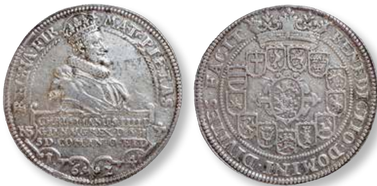
Fig. 2. En af de tidligste specie-dalere hvor kongens portræt afviger ved at have en pibekrave og kronen på bagsiden ikke bærer bøjler (Hede 60B og 61B, AH 23.1 og 23.2).

antager derfor, at Den beskrevne omsmelting er gået til de nævnte Hede-numre.