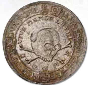
Schleswig-Holstein-Sonderburg. 2 Taler, 1622. Johann the Younger. Dav-A3715, Bruun-14664. NGC MS-61.