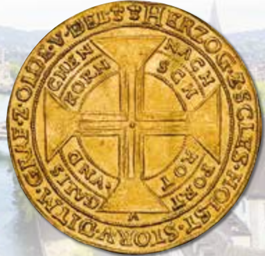
Schleswig-Holstein-Gottorp. 10 Ducats (Portugaloser), ND. Johann Adolf. Fr-1502 var, Bruun-14145. NGC Unc Details—Cleaned.

Featuring Coins from Denmark, Norway, Sweden and Schleswig-Holstein