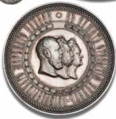
Rusland Alexander III "Memory of the Opening of St. Peterburg Maritime Canal" sølvmedalje 1885 Hammerslag: 60.000 kr.