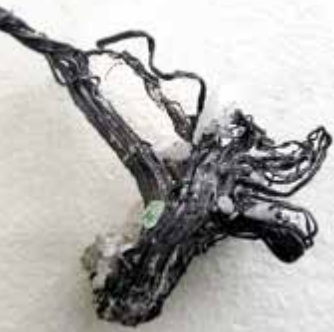
En sølvstuf (trådsølv) fra Kongsberg som består af næsten 100% rent sølv. De er sjældne på verdensplan, men var helt almindelige i Kongsbergminerne. Bergverksmuseet har bevaret sølvstuffer på op til 50 kg.

Tråden befinder sig på The Natural History Museum, London.