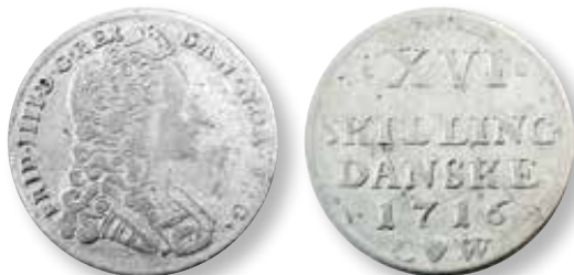
Fig. 1. Ægte dansk 16 skilling 1716, H47 (værdi 15 skilling i møntomløbet). Samme type som den mønt Knud Bech lånte.

2 Møntens pålydende var 16 skilling, men den blev i møntomløbet omtalt som 15 skilling, der var dens nedsatte værdi jfr. forordning af 31. juli 1726. Kirsten Mordhorst, Dansk Pengehistorie. Bind III: Bilag , Danmarks Nationalbank 1968.