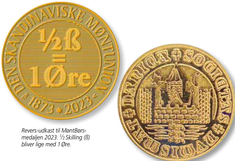
Revers-udkast til MøntBørs-medaljen 2023. \frac{1}{2} Skilling ( \beta ) bliver lige med 1 Øre.

Leveres ved fuld betaling ( eventuelle forsendelsesomkostninger tillægges ) til DNFs bankkonto (se side 31).