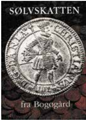
'Køleskabs'-magnet til erindring om Læsø-skatten 7x9 cm

Skatten som den er udstillet på Læsø Museum.