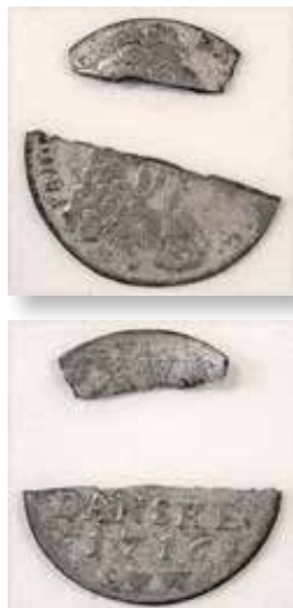
Fig. 2. Rester efter probering af den mønt, som Knud Bech lånte. Ca. 125%.

Den hurtige indkaldelse til forhørene viser, at sagen indledningsvis blev behandlet med største alvor. Til gengæld blev der slækket betydeligt på tempoet i den videre sagsbehandling efter det andet politiforhør, hvor man formentlig har erkendt, at sagen reelt var afsluttet.