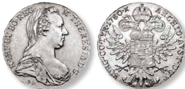
Sådan ser den 'rene' MTT ud, når samlere f.eks. støder på den i mønthandlerens bakker. Dette eksemplar, som er slået i Wien 1945-60, har mindst seks små varianter, som vises under billedet i kataloget