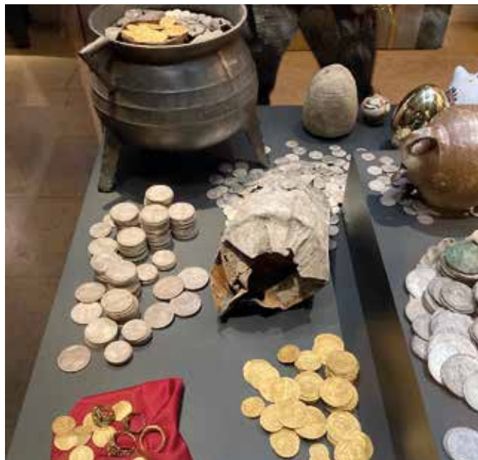
Fra udstillingen Ka-Ching på Nationalmuseet.