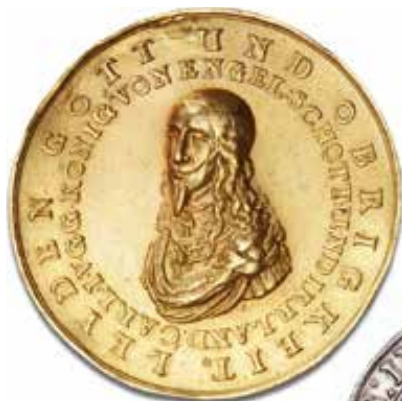
England, Charles I Guldmedalje til minde om henrettelsen af kong Charles, 1649 Hammerslag: 85.000 kr.