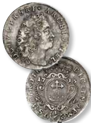
Johann Wilhelm II, 1679-1716. Hertug Jülich/Berg. 1/6 Taler 1710.

Måske havde hertugen mange ukendte børn?