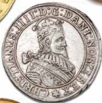
Norge, Christian IV Speciedaler 1628 Hammerslag: 48.000 kr.