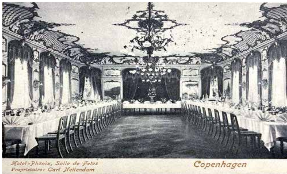
Hotel-Phoenix, Salle de Fetes Propriétaire: Carl Neiiendam

Postkortet med festsalen i Hotel Phoenix, poststempelt 1903.