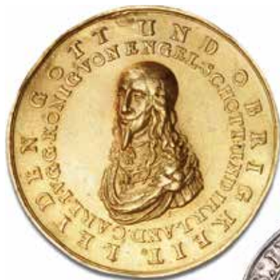
England, Charles I Guldmedalje til minde om henrettelsen af kong Charles, 1649 Hammerslag: 85.000 kr.