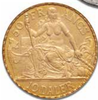
Dansk Vestindien Christian IX, 50 Francs/10 Daler 1904 Hammerslag: 75.000 kr.