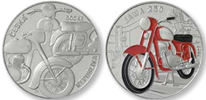
500 Ckr sølvmønten med Jawa 250 motorcyklen

TSCHECHIEN eller på dansk Tjekkiet har i 2022 udsendt en 40 mm stor 500 Ckr. sølvmønt i to kvaliteter med oplag på hhv. 9.877 og 20.123 ekspl. Mønten bærer den ikoniske Jawa 250, som også herhjemme i Danmark var en meget populær motorcykel i 1950 og 60'erne.