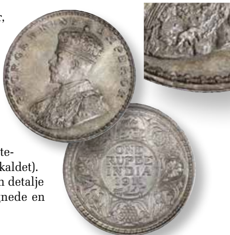
Kong Georg V Rupee 1911 med den famøse griselignende elefant