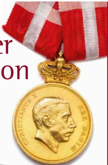
Danmark, Christian X Fortjenstmedalje Hammerslag: 100.000 kr.