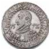
Danmark, Frederik II Speciedaler 1572 Hammerslag: 30.000 kr.