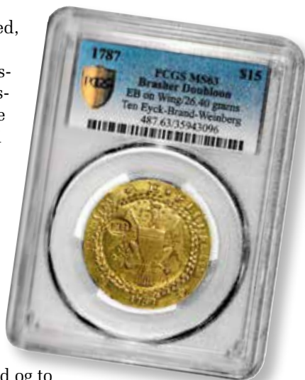
Brasher's dublon 1787 med kontra på vingen.

Senere protesterede muslimerne over en detalje i kong Georg V's kappe, som de mente lignede en gris . . .