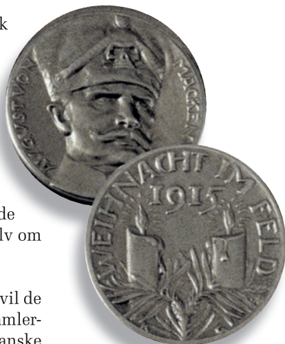
To lys markerer anden jul i skyttegravene

USA. En lærer i Louisiana samlede for 45 år siden en 1-cent op fra gaden. Det har han gjort lige siden. Venner og pårørende har også været flinke til at hjælpe til med 1-cents. Til sidst havde han 15 tyve liters plastic-container, som han i første omgang prøvede at pådutte sit forsikringsselskab. Da det nægtede at modtage de mange mønter, kørte han med venners hjælp til banken for at veksle mønterne. Først måtte bankpersonalet skaffe to økser for at få kål på boksene. Det tog fem timer at køre