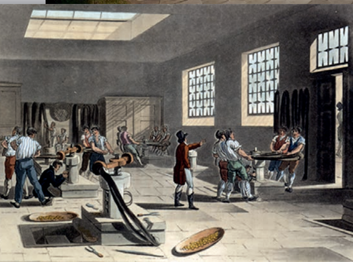
Royal Mint i Llantrisant i Wales har slået dørene op for publikum.

Fra den daglige møntproduktion i Tower of London. Tegning ca. 1809.