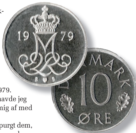
I 1980 verserede der stærke rygter om, at 10-øren 1979 var svær at få fat i.

Og pointen eller læren af dette; Det er svært at være spekulant. Fra måske at være en sjælden mønt, er 10-øren 1979 nu nok en af de bedst bevarede!