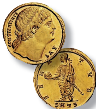
Smuk medaljon med Constantin den Store

År 2017 er måneåret for hanen efter kinesisk regnskab. Her i 5 ounce sølv og 5 ounce guld. De er således mindst metalvægten værd.