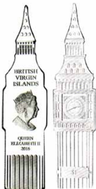
Elizabeth Tower med Big Ben

Siden 2012 har tårnet i øvrigt heddet Elizabeth Tower.