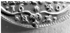
Figur 9: Mønt med forside type 2 med rettet stempel. Initialerne HK er rettet til et lidt større H, og ildrageren er rettet til et større K.

Det sidste stempel fra 1647 er ret sjældent forekommende, og jeg har derfor placeret det som det sidste, idet jeg antager, at udmøntningen er standset inden stemplet har nået en betydelig anvendelse. Det er selvfølgelig muligt, at stemplet ret hurtigt er blevet ødelagt og derfor er så forholdsvis sjældent forekommende. Rækkefølgen af de to sidste stempler er således ikke helt sikker, men en kobling med et bestemt bagsidestempel giver dog yderligere et argument for den opstillede rækkefølge (se senere).