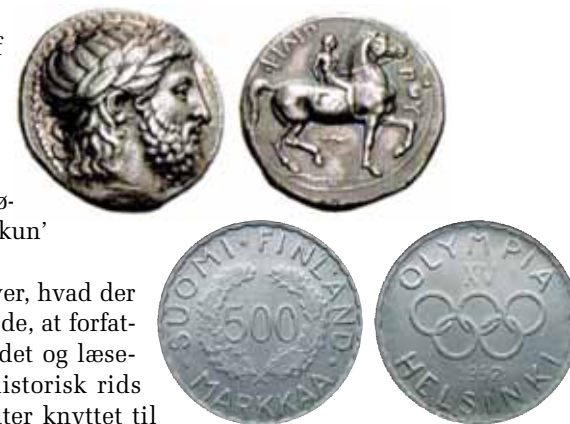
Philip II markerer sin sejr i Olympia Finland udmøntede 1951 første OL-mønt i nyere tid

Er man bidt af OL-mønter, må denne første udgave derom være et must.