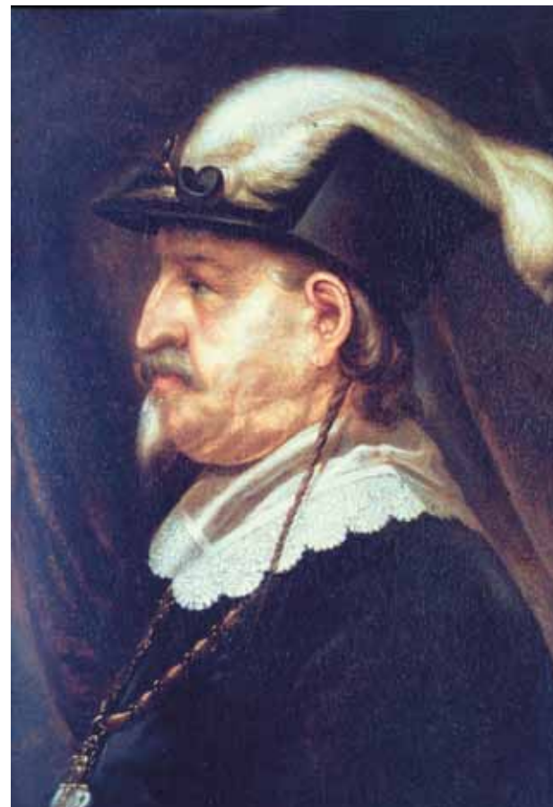
Figur 8: Maleri af Christian IV i profil fra venstre. Efter slaget på Kolberger Heide lod kongen sig kun male i profil fra venstre, så man ikke skulle se den læderede højre side af hans ansigt. Maleri af Karel van Mander d.y. (1609-70). Frederiksborg.

Der findes fem forsidestempler, som er vist i Figur 3-7. I figurerne er stemplerne ordnet i en rækkefølge, som jeg