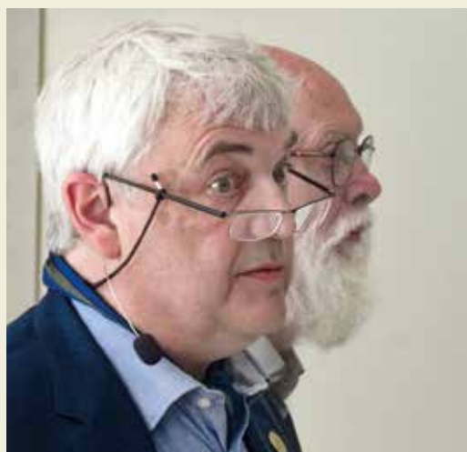
Mötets ordförande och sekreterare.

a) Projektupplägg för återaktivering av unionens hemsida hade sänts ut. Mötet beslöt godkänna projektets uppläggning.