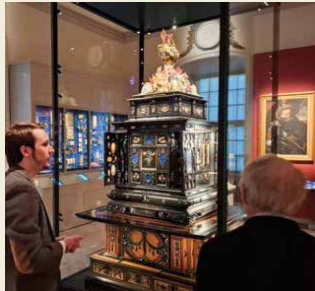
Augsburska skåpet.