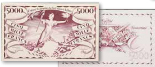
FRENCH EQUATORIAL AFRICA. Caisse Centrale de la France Libre. 5000 Francs, ND (1941). P-14Ap1 & 14Ap2. SB1187. Front & Back Proofs. From the Al Kugel Collection. Realized $25,200