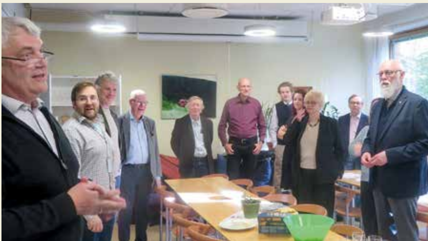
Mingel i Numismatiska Forskningsgruppens lokaler.

Jens Christian hanterade ordförandeklubban elegant – trots att han under styrelsemötet inte hade mindre än tre olika roller. Förutom att inneha ordförandeposten, företrädde han i valda delar även SNF och DNF. Det senare då DNF inte hade möjlighet att delta på unionsmötet. Mötet följde den i förväg utskickade dagordningen och punkterna han-