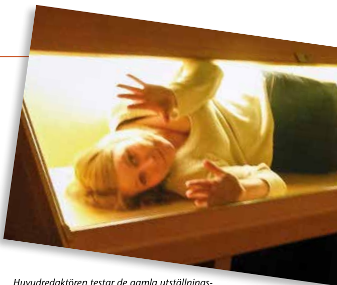
Huvudredaktören testar de gamla utställningsvitrinernas kvalitet.

På alla dessa frågor är jag själv beredd att svara ja. Möjligheten finns – om viljan finns. Men Medlemsbladets framtid är inte något redaktören ensam kan eller skall avgöra. Det kräver en gemensam diskussion bland samtliga unionsmedlemmar. Därför hoppas jag att frågan behandlas grundligt på lokal nivå under de kommande tre åren, så att den kan tas upp på unionsmötet i Finland 2028. Hur vill vi att unionsbladets framtid ska se ut?