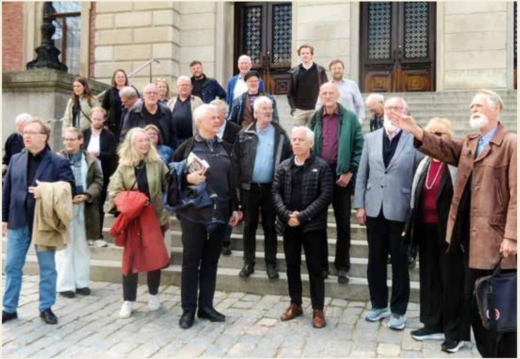
NNU möte 2025. Vid trappan till Uppsala universitet.