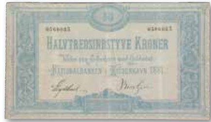
DENMARK. National Bank. 50 Kroner, 1881. PMG Very Fine 30. From the L. E. Bruun Collection. Realized €38,400