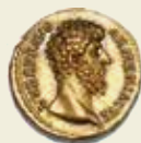
Romerriget Lucius Verus, 161-169 e.v.t. Hammerslag: 85.000 kr.