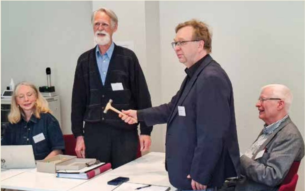
Ordförandeklubban lämnas över.

rats. Omfattande utgivning av böcker. Medalj till unionsmötet presenterades och överlämnades.