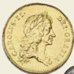
Charles II, 1660-1685 5 Guineas 1672, London Hammerslag: 70.000 kr.