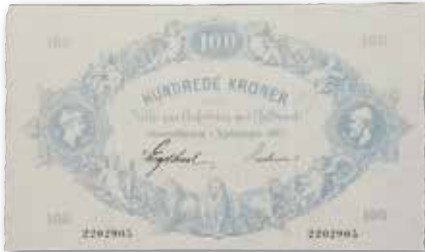
DENMARK. National Bank. 100 Kroner, 1887. PMG About Uncirculated 53. From the L. E. Bruun Collection. Realized €57,600