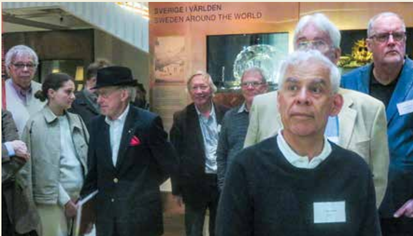
Besök i Ekonomiska museets utställning.

terades snabbt och smidigt. Vid några tillfällen uppstod diskussioner och rapporterna från medlemsinstitutionernas verksamhet under de tre gångna åren drog något ut på tiden. I vissa fall fick redovisningen därför kraftigt bantas. Prick klockan 12:30 kunde Jens Christian förklara unionsmötet avslutat och deltagarna kunde bege sig till en framdukad lunch på Historiska museet.