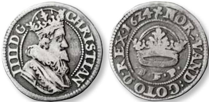
Figur 1. Udgangspunktet for BørsMønten – Halvkronen 1624 (Hede 128, AH 23.13.3. Det bemærkes, at det er varianten uden 'DANI').

Med hensyn til retten til det fundne sølv var det, ifølge Bjergloven af 1539, finderens som havde retten til at udnytte mineralforekomsten. Dette så kongen imidlertid stort på og befalede i et 'åbent brev' af 21 december 1623, at enhver, som havde købt ulovligt frembudt sølv, skulle levere dette til statholder Jens Juel.