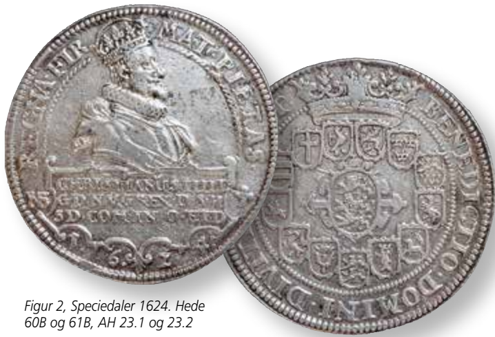
Figur 2, Speciedaler 1624. Hede 60B og 61B, AH 23.1 og 23.2

Alt dette er nok sket efter sædvanligt mønster, idet Danmark hidtil havde været et land uden bjergsølv, og lødigheden af mønt fra sådanne lande havde ikke så stor respekt. Wilcke antager derfor, at den beskrevne omsmelting er gået til de nævnte Hede-numre.