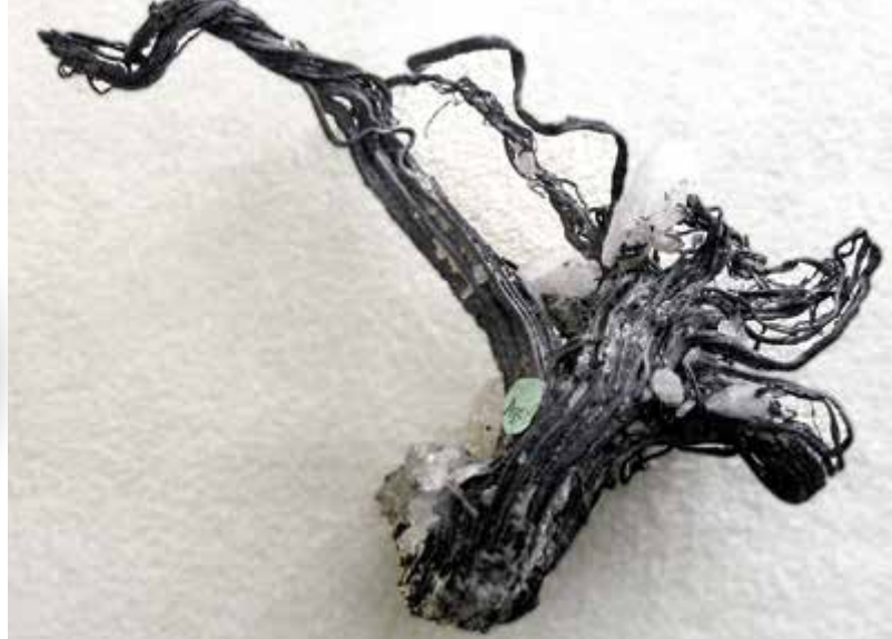
En sølvstuf (trådsølv) fra Kongsberg som består af næsten 100% rent sølv. De er sjældne på verdensplan, men var helt almindelige i Kongsbergminerne. Bergverksmuseet har bevaret sølvstuffer på op til 50 kg. Tråden befinder sig på The Natural History Museum, London.

cier. Kongen har følt sig overordentlig velhavende, hvilket da også var et ubestrideligt faktum på dette tidspunkt.