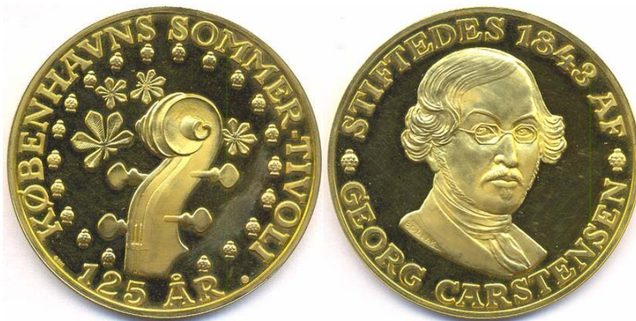
Nr. 1 Tivoli 125 år